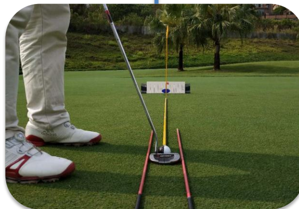
杆面要与目标线方正垂直